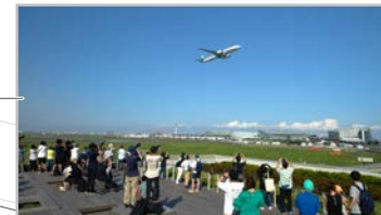
南風時の15:00-19:00頃、矢印向きに飛行機が離陸します。