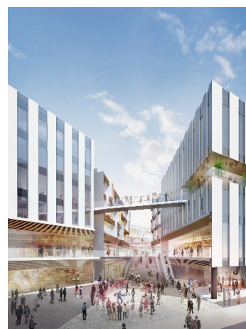
交通広場より (イメージ)