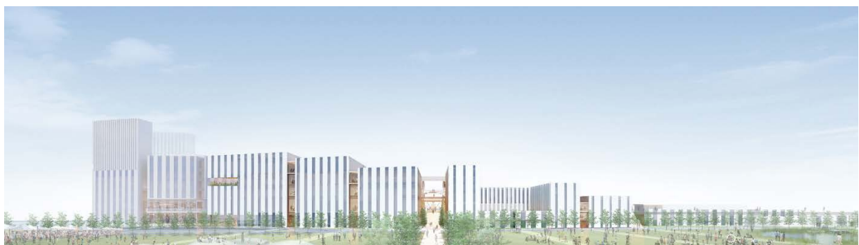
多摩川方面より (イメージ)

＜本件に関するお問い合わせ先＞ [羽田みらい開発株式会社 代表企業] 鹿島建設株式会社 広報室 TEL:03-6438-2557