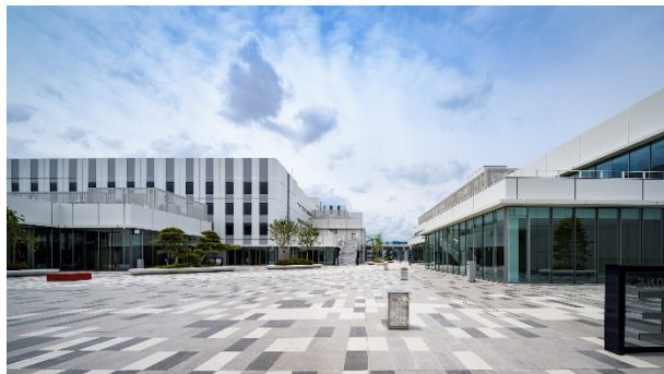
イノベーションコリドーからみる建物群

HiCity の各建物を結ぶイノベーションコリドーは、日本庭園の配植をベースにした植栽や、花札の絵柄に現代モダンアートの要素を加え、さらに日本の四季折々の音を奏でる「花燈籠」が施されており、訪れる人を迎え入れます。また、施設の屋上には、足湯スカイデッキが整備され、羽田空港を望む絶景を楽しむことができます。季節による植栽の変化や、イベントなどの開催に合わせたライティングや音の変化によって、HiCity を訪れた方々に向けて、日本の四季や文化の美しさを提供します。