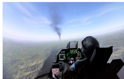
戦闘機ファイター体験