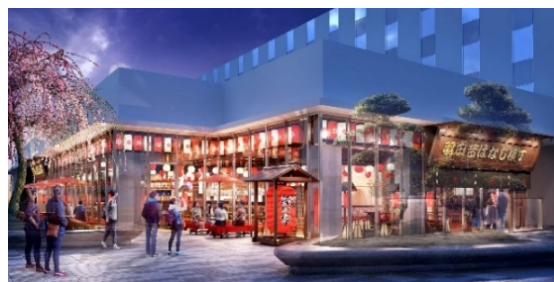
日本食体験レストラン

海外の観光客へ日本食や日本の食文化を発信することはもちろん、日本人にとっても日本食の魅力を再発見できるよう各分野において本物の「ルーツ」を持つ名店とコラボすると同時に、昔ばなしの世界に入り込んだような空間づくりにこだわり、日本の文化を五感で楽しめる空間です。