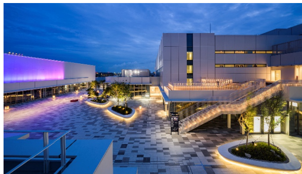
イノベーションコリドー(夜景)