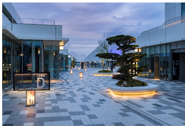
日本庭園の配植をベースにした植栽