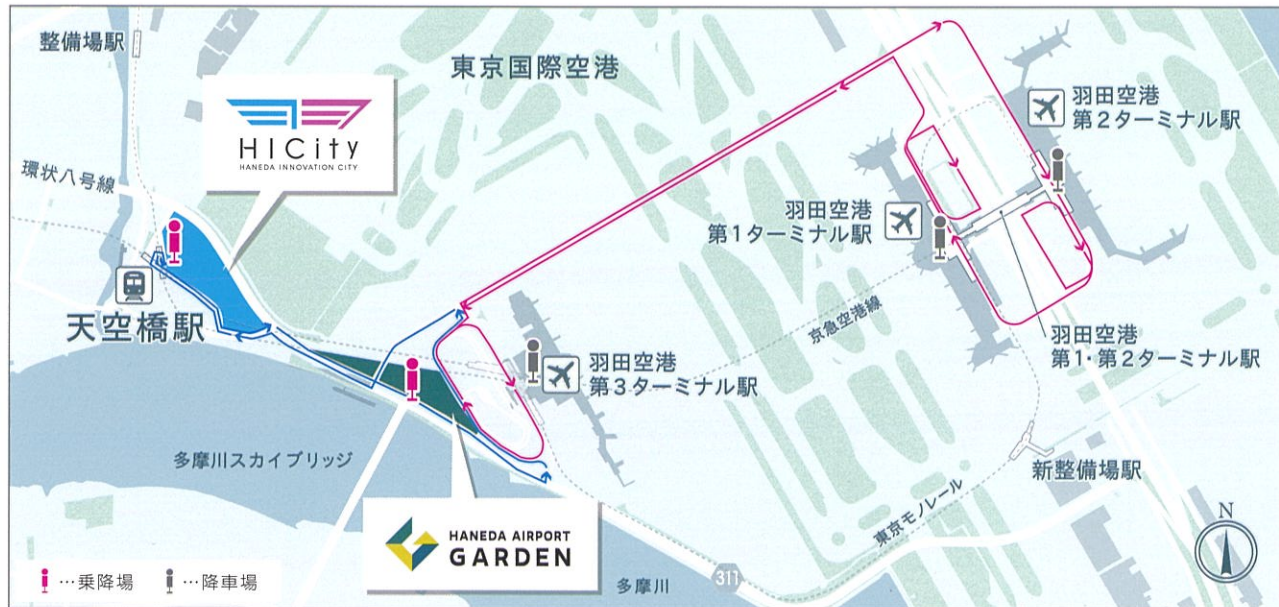
乗降場① 羽田イノベーションシティ (HIC)